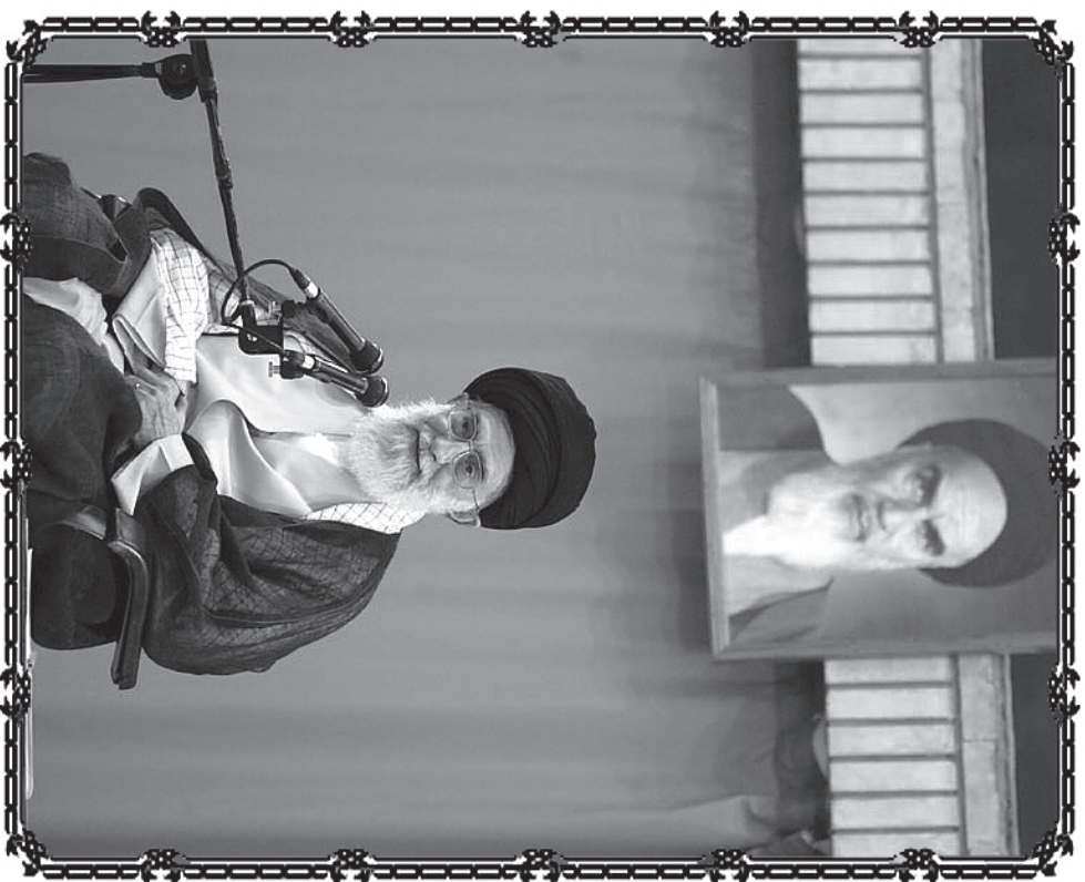
Líder da Revolução Islâmica Ayatullah Al-Odhma Assayed Ali Al-Hussaini Al-Khamenei (D.D.).

القيامة يقال لغارم القرآن: اقرأ وارق، فكلما قرأ آية رقى درجة ﴾